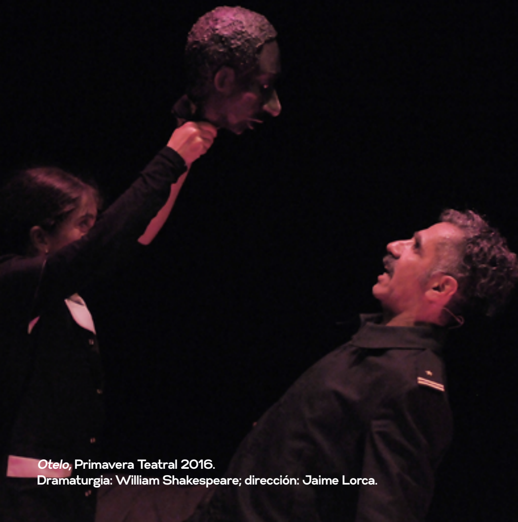
Otelo , Primavera Teatral 2016.