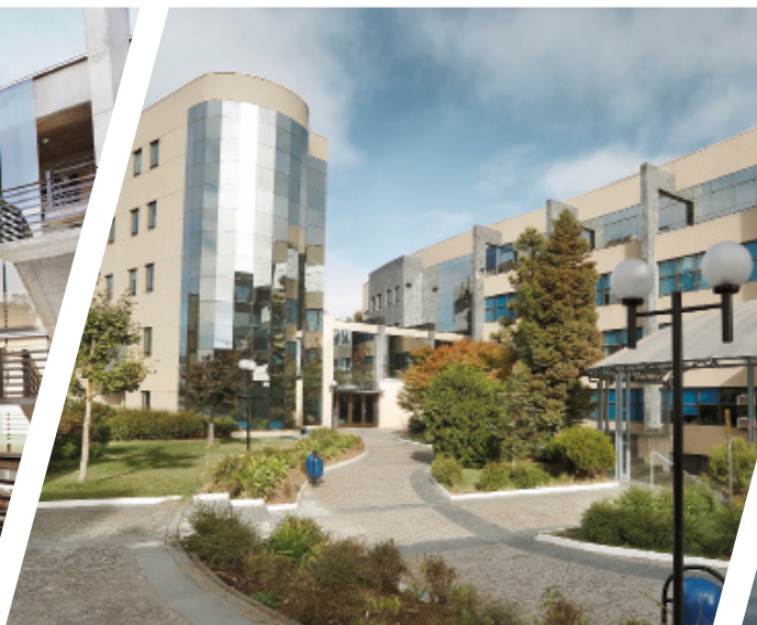
Campus Las Tres Pascualas, Sede Concepción.