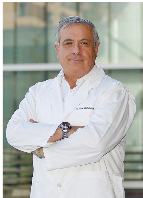
Dirigido por el ex ministro de Salud, doctor Jaime Mañalich, está integrado por académicos y estudiantes que se relacionan con la Salud, además de especialistas externos que colaboran con el instituto.

IPSUSS Instituto de Políticas Públicas en Salud