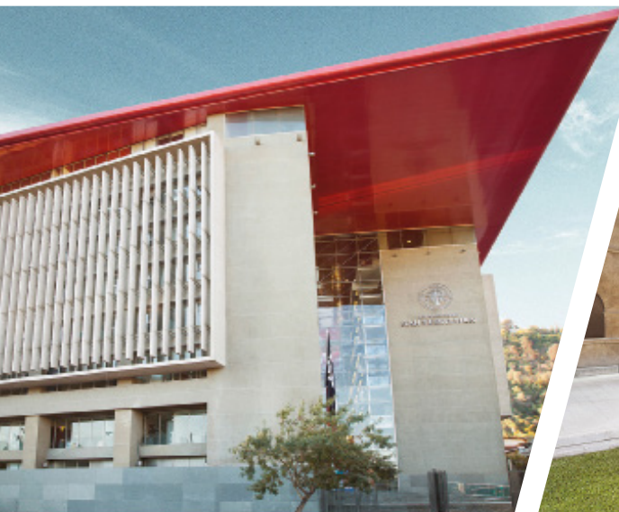
Campus Bellavista, Sede Santiago.