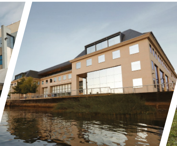
Campus Valdivia, Sede Valdivia.