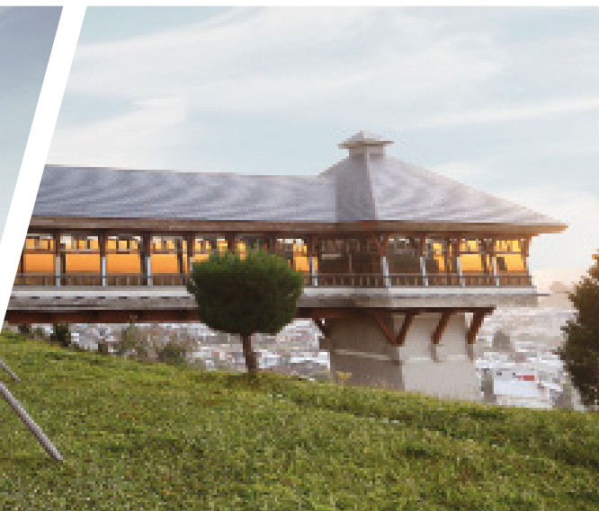
Campus Pichi Pelluco, Sede De la Patagonia en Puerto Montt.